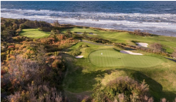
Links at Crowbush Cove.