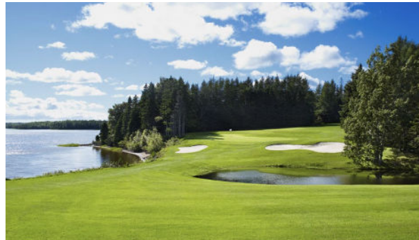
Brudenell River GC.